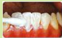
4. フッ化物物の塗布

ゴムやブラシなど、柔らかい材質の器具による処置なので 痛みもなく、心地よい範囲の刺激 で行われます。