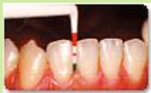
1. 歯・歯肉のチェック